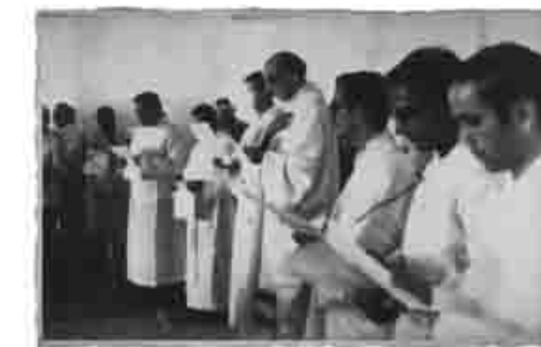
Missa concelebrada de corpo presente no dia do enterro de Pe. Henrique

Novamente, em posição de ameaça, os soldados se dirigem contra a multidão, com armas nas mãos. Os padres se sentam, o caixão de novo é colocado no chão, ouvem-se gritos de medo e de protesto. Pessoas do povo choram: por que mataram um padre? Dom Helder pede calma, muita calma. A cavalaria começa a andar, paralela à multidão, amedrontando dez mil pessoas.